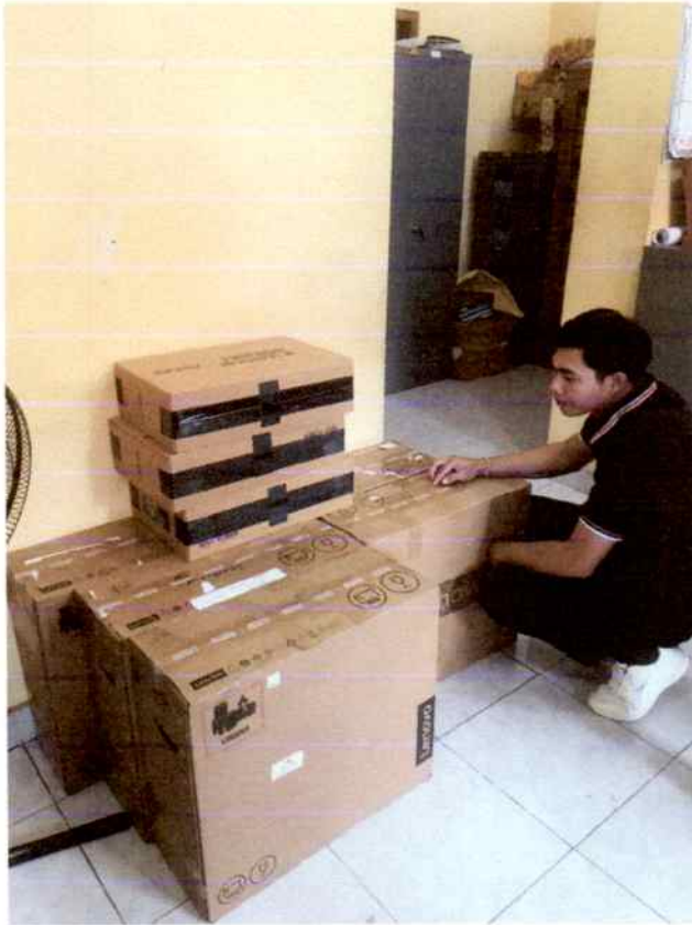
FOTO SARANA DAN PRASANA